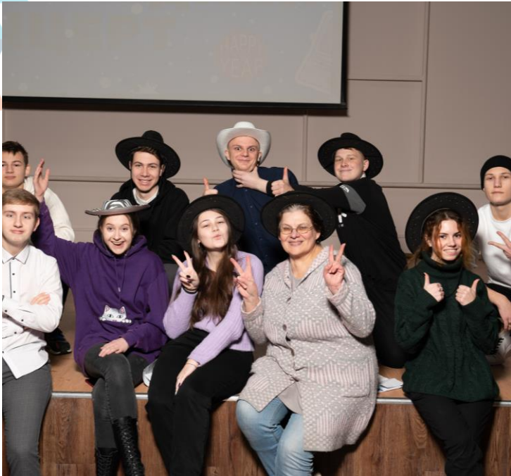
Студенческое самоуправление Волонтерский отряд