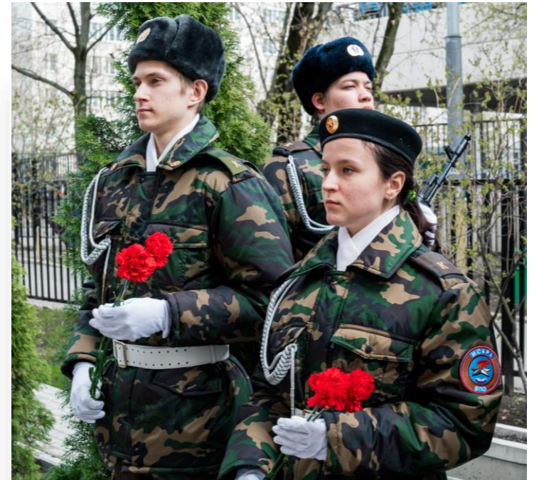
Военно-патриотическое объединение «Искра»