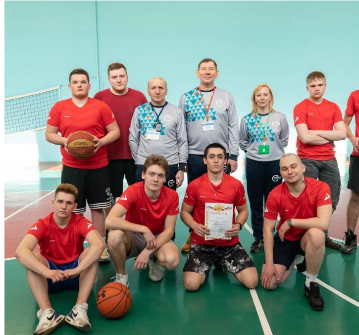
Спортивный клуб «Феникс»