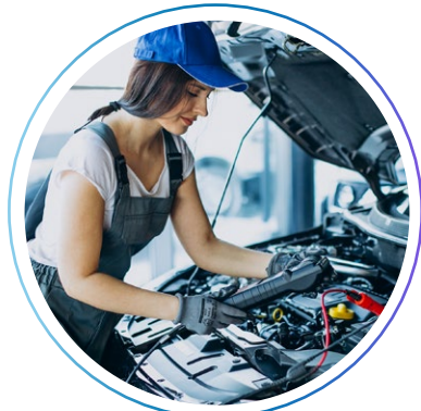
слесарь по ремонту дорожных машин